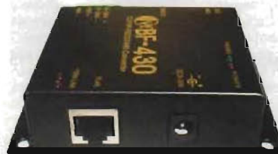
BF430 – převodník RS232/TCP-IP